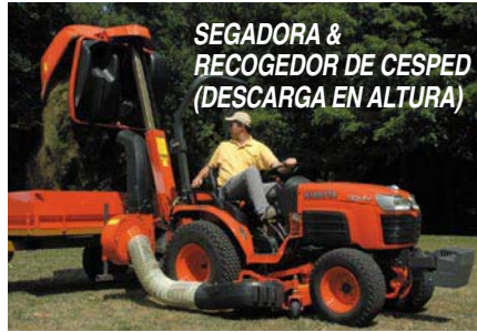
SEGADORA & RECOGEDOR DE CESPED (DESCARGA EN ALTURA)