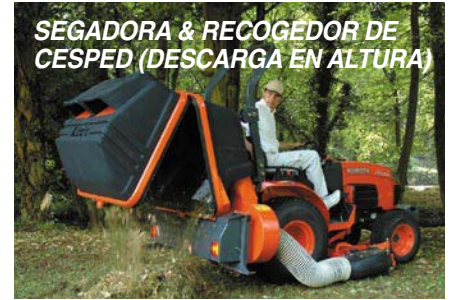
SEGADORA & RECOGEDOR DE CESPED (DESCARGA EN ALTURA)