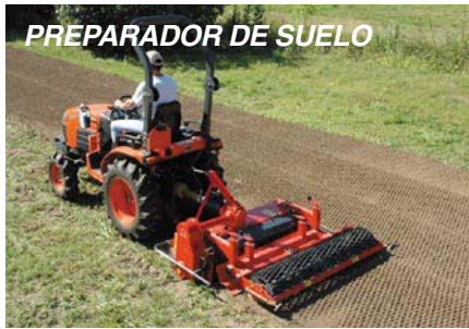
PREPARADOR DE SUELO

Kubota le ofrece las herramientas que necesita para hacer su trabajo.